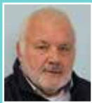
Jean-Marie Dedecker burgemeester