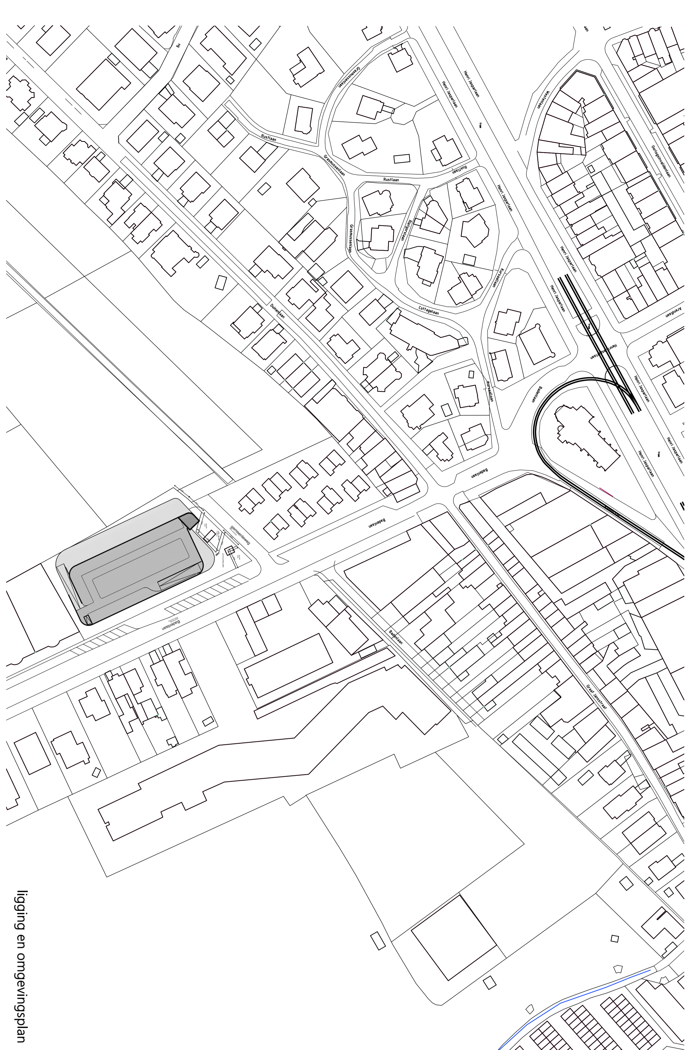
ligging en omgevingsplan