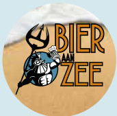
Bier aan zee Middelkerke p. 22-23