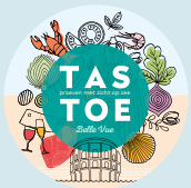
Tastoe Westende p. 8-10