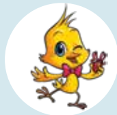
Hupsakee Pasen p. 4-5