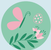
Volledige kalender p. 12-14