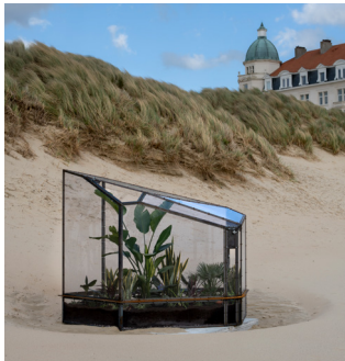
SAMMY BALOJI ...and to those North Sea waves whispering sunken stories