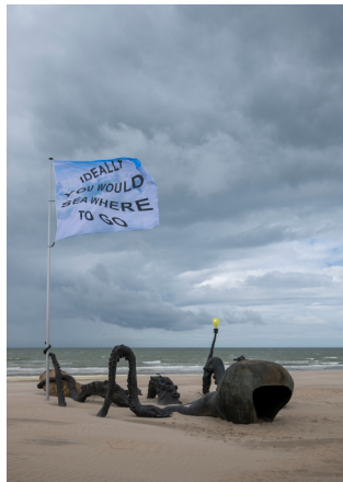
LAURE PROUVOST Touching To Sea You Through Our Extremities

C* Route tussen knooppunt 67 en 8 verlaten, via Oostendestraat en Marktstraat naar kunstwerk Maarten Vanden Eynde (nr 6).