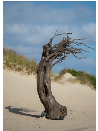
ELS DIETVORST Windswept